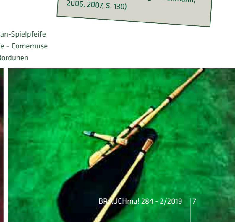
Links: Hümmelchen mit 3 Bordunenm Sopran-Spielpfeife in d´ - Sopran-Spielpfeife in c´ - Alt-Spielpfeife in f. Unten links: Zentralfranzösische Sackpfeife – Cornemuse de Centre; Unten rechts: flämisch/deutsche Schäferpfeife mit zwei Bordunen