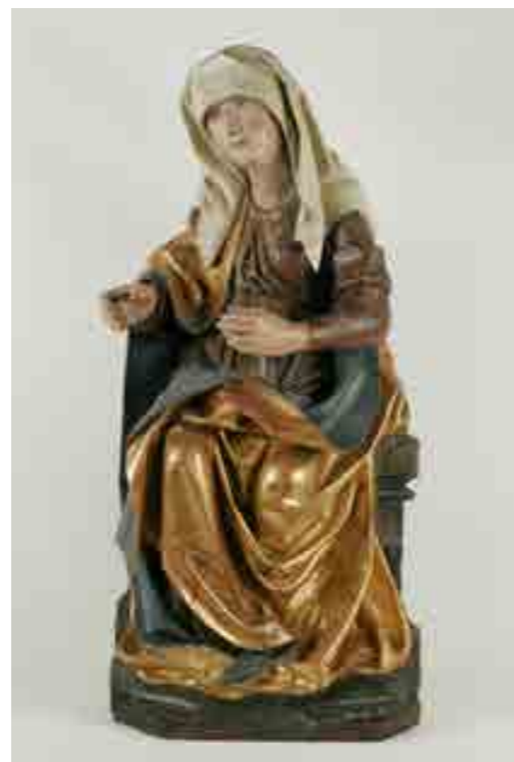
Hl. Anna, Skulptur aus Lindenholz, gefasst, unbekannter Künstler um 1490/1500. OÖ. Landesmuseum, Sammlung Kunstgeschichte (Inv.-Nr. Ka 286).

Zitieren wir Paulus von Tarsus (um 5 bis 64/67 n. Chr.), besser bekannt als Apostel Paulus. Im ersten Brief an die Korinther (11,7-10) schreibt er: „Der Mann darf sein Haupt nicht verhüllen, weil er Abbildung und Abglanz Gottes ist; die Frau aber ist der Abglanz des Mannes. Denn der Mann stammt nicht von der Frau, sondern die Frau vom Mann. Der Mann wurde auch nicht für die Frau erschaffen, sondern die Frau für den